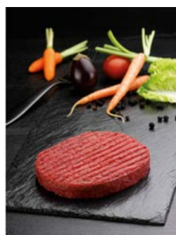
Steak haché Rond VBF Façon bouchère 120 gr x 50 Code 4737