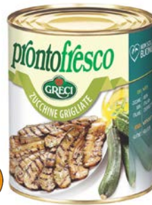
Courgettes grillées 4/4 750 gr Pronto fresco Code 109