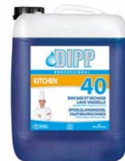
Rince/Sèche lave-vaisselle Bidon de 10L Code 7798