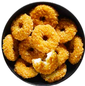
Mini Smoky Cheese Donuts 34/40 pièces - Sac 1 kg Code 8625