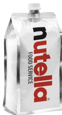
Nutella Cartridge Poche 1 kg x 6 Code 10356