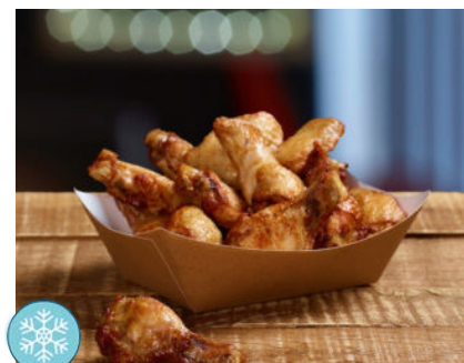
BBQ Chicken Wings Sac 1 kg Code 9348