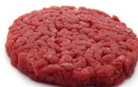
Steak haché Charolais Rond 15% 150 gr x 20 Code 7523