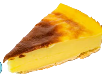
Maxi Flan 27 cm - 10 p découpées Code 6027