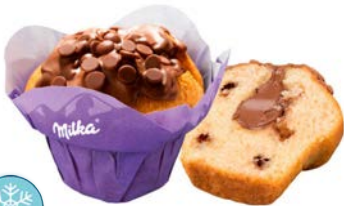
Muffin fourré Milka 110 gr carton de 36 Code 23837