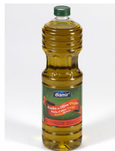
Huile d'olive Extra Vierge Bouteille 1L Code 3123