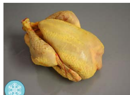
Poulet jaune Carton de 10 pièces d'environ 1.3 kg Code 5439