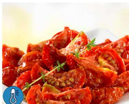
Tomates confites Sobreval Barquette 1kg Code 2602