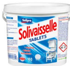
SOLIVAISSELLE Machine 160 tablettes Code 59218