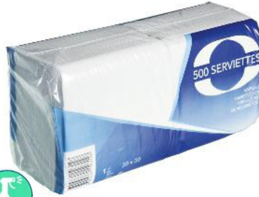
Serviette blanche - 1 plis Paquet de 500 Code 75213