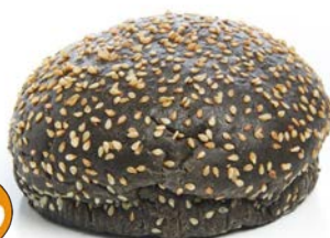
Pain hamburger Encre de Seiche 80 gr - 2x15 Code 6927