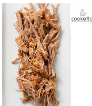
Effiloché de Poulet 1 kg Code 10179