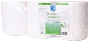
Papier essuie main Paquet de 6 rouleaux Code 17492