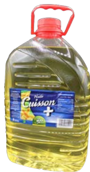
Huile de Friture Cuisson + 5L Code 2544