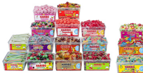
Colis Haribo 13+3 Gratuits Code 116224