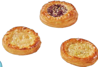
Mini Tartelettes beurre assorti Cassis/Pomme - Ananas/Passion - Pomme/poire 35 gr x 144 Code 92950