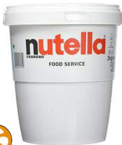
Nutella Professionnel Pot 3 kg Code 5482