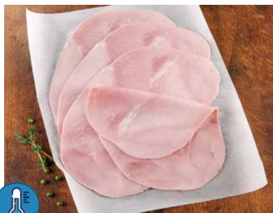
Jambon Supérieur France Paquet de 20 tranches - 840 gr Code 506281