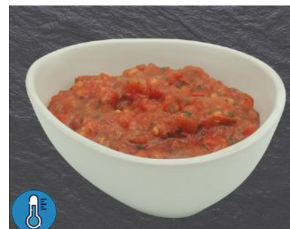
Tartare de tomate Sobreval Barquette 1kg Code 9493