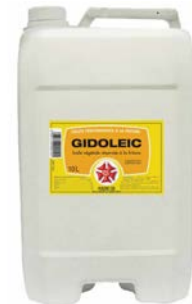
Huile de Friture GIDOLEIC 10L Code 8017