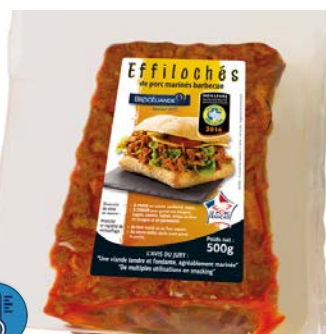
Effiloché de Porc Barbecue 500 gr Code 8239