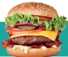
VEG BISTRO BURGER IQF 1 KG Code : 10188 équivalent steak de boeuf