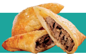
VEG GRENE IQF 1 KG Code : 10184 équivalent au boeuf égréiné