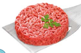
Steak haché Rond VBF 15% Façon bouchère 150 gr x 40 Code 7309