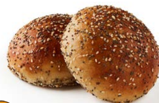
Pain hamburger Multigraines 80gr 2x15 Code 6670