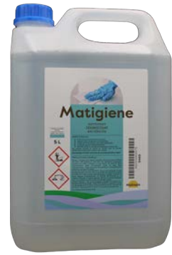
Matigiene 5L Code 9469