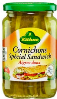
Cornichons aigre doux 3/1 Code 9897