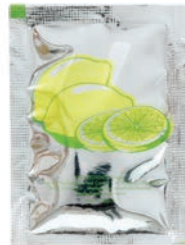
Serviette rince doigts 500 pièces Code 817570