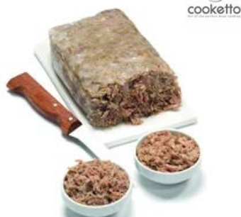
Effiloché de Canard 1 kg Code 5520