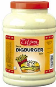
Sauce Big Burger Colona Pot de 3L Code 8014