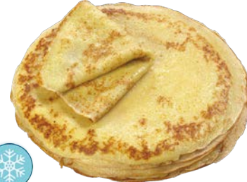
Crêpe froment sucrée 35 cm carton de 50 Code 1539