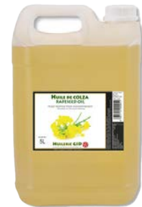
Huile de Colza 5L Code 2793