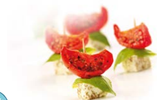
Tomates mi séchées IQF Sobreval Poche 2kg Code 9968