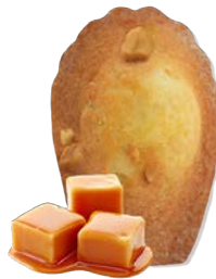
Madeleine fourrée Caramel au Beurre salé 51 gr x 70 Code 10017