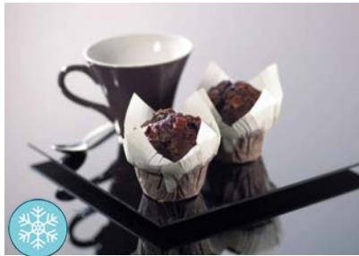
Muffin Double Chocolat 120g carton de 24 Code 6026