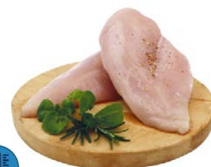
Filets de Poulet BZH cru 350 gr - Barquette 2,5 Kg Code 9350