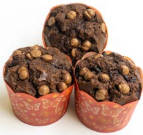
Muffin Triple Chocolat 133g carton de 24 Code 3662