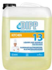
Liquide vaisselle 10L Code 2771