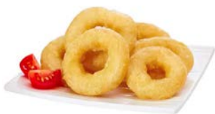
Beignet Calmar Romaine 40/60 Sac 1 kg Code 8643