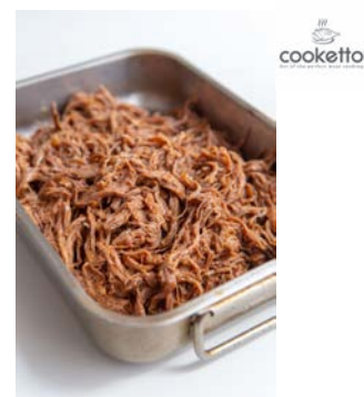
Effiloché de Boeuf 1 kg Code 10178