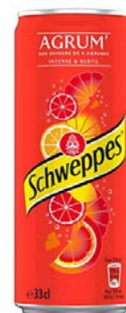
Canette Schweppes Agrume Pack de 33cl x 24 Code 62513