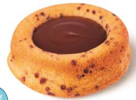
Petit tigre 30 gr carton de 80 Code 9877