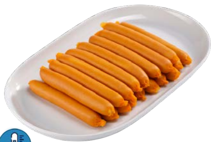
Saucisse de Francfort Boyaux naturels paquet de 20 Code 5231