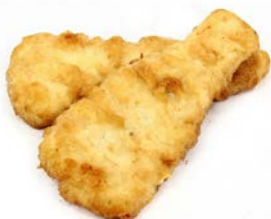
Fish'n Chip Merlu du Cap Carton de 5 kg 180/210gr Code 5126