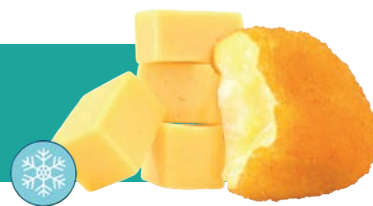
VEG NUGGET SWISS IQF 1 KG Code : 10186 équivalent au nugget d'emmental