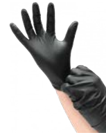
Gant vinyle T6 - S Paquet de 100 Code 7621