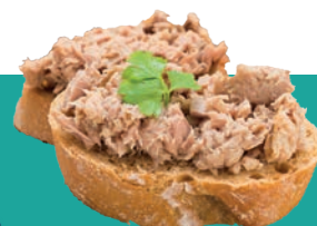
VEG TOONA NATURE IQF 1 KG Code : 10189 équivalent miettes de thon nature