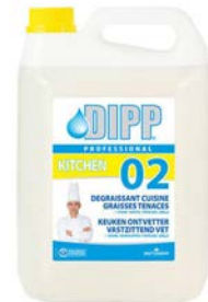
Dégraissant surpuissant 5L Code 1106