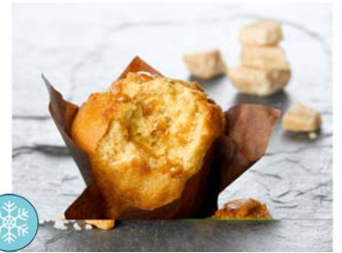
Muffin Caramel au Beurre Salé 122g carton de 15 Code 4808