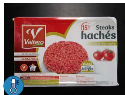
Steak haché Rond 15% BZH Façon bouchère Carton de 125 gr x 8 Code 8833