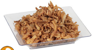
Oignons Frits sachet de 1kg Code 77