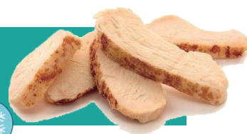
VEG LAMELLES NATURE IQF 1 KG Code : 10192 équivalent émincé de poulet