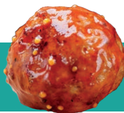
VEG BALLS IQF 1 KG Code : 10191 équivalent boulette de boeuf