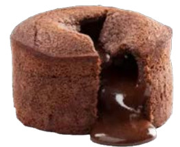
Coulant Fondant Coeur Chocolat 90 gr x 18 Code 5142