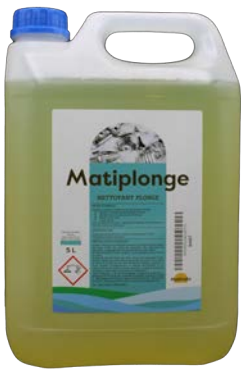
Matiplonge 5L Code 9467