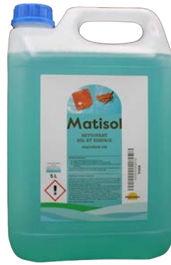
Matisol 5L Code 9468