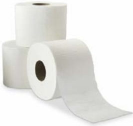
Papier toilette Rouleau de 150 feuilles - 2 plis x 24 Code 6209