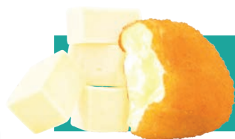
VEG NUGGET CREAMY IQF 1 KG Code : 10187 équivalent au nugget de Mozza