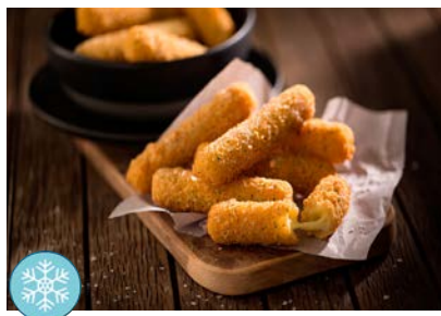
Finger Mozzarella pané Sac 1kg pièce de 20 gr Code 4267