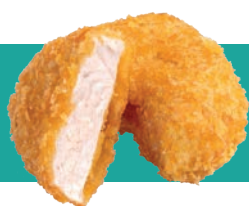
VEG NUGGETS CHICKN IQF 1 KG Code : 10185 équivalent au nugget de poulet