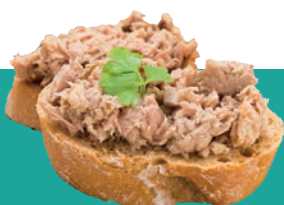
VEG TOONA CITRON BASILIC 1 KG Code : 10190 équivalent miettes de thon citron basilic