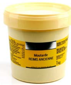
Moutarde à l'ancienne Seau 1 Kg Code 2786