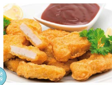
Nuggets Filet de Poulet Sac 1 kg Code 5742